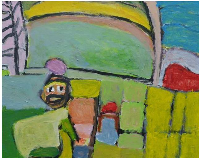
Juha Valkama, Japanilainen mummo 2015

JUHA VALKAMA | maalauksia | 5.8. - 23.8.2015