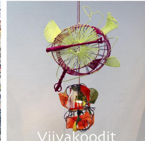
Viivakoodit Michael Rasmussen Kettukin Vuoden taiteilija 2020

12.9.–15.11.2020 Voipaalan taidekeskus ti-pe klo 11-17, la-su 12-18, ma suljettu Liput: 6/5/1 € voipaala.valkeakoski.fi Sääksmäentie 772, 37700 Sääksmäki