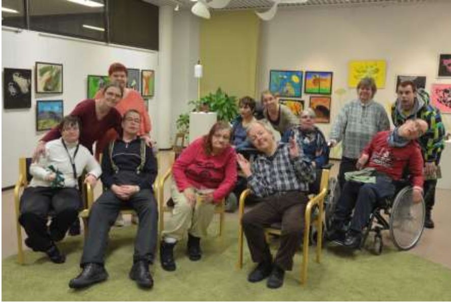
Eläinten syksy - näyttelyn avajaiset