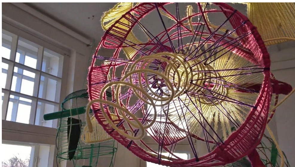
Michael Rasmussen: Turbine, 2018, vaijeri ja lanka

| 12.9.- 15.11.2020 | Voipaalan taidekeskus, Valkeakoski