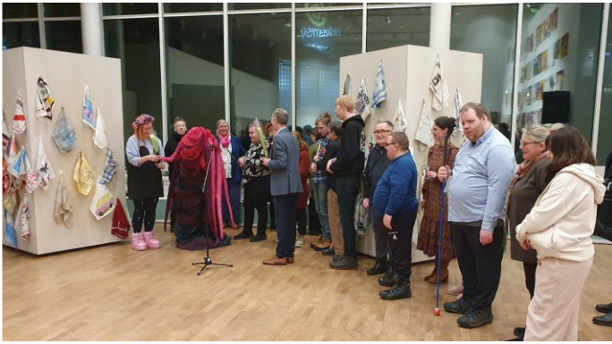
Näyttelyn taiteilijoiden kukittaminen avajaisissa 24.1.2026.