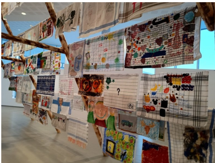
Yksityiskohta My Everyday -näyttelystä. Galleri Nord Norge.

Pohjoismainen yhteistyö jatkui aktiivisena vuonna 2025. Yhteistyön taiteellinen ydin oli vuonna 2022 alkanut yhteisöllinen My Everyday -teos. Vuonna 2025 teokseen osallistuvien taiteilijoiden määrä kasvoi noin 200 tekijästä yli 300 osallistujaan eri Pohjoismaista. Teos on konkreettinen esimerkki pitkäjänteisestä pohjoismaisesta yhteistyöstä, jota alalla on tehty jo vuodesta 2015 lähtien.