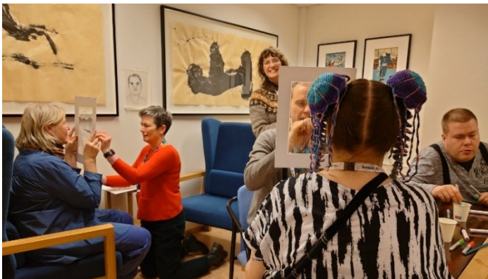
Suomalaiset, ruotsalaiset ja norjalaiset osallistujat tutustumassa toisiinsa ennen avajaisia järjestetyssä työpajassa.